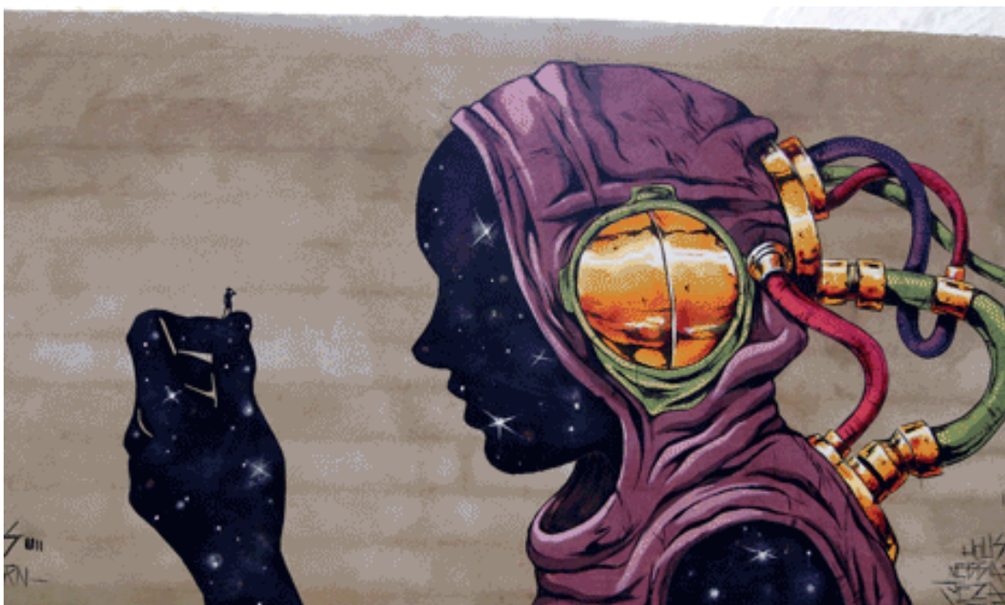
GRAFFITI AUTOR: DEIH

que es limitada nos ha favorecido la posibilidad de ir desarrollando aceleradamente muchas cosas.