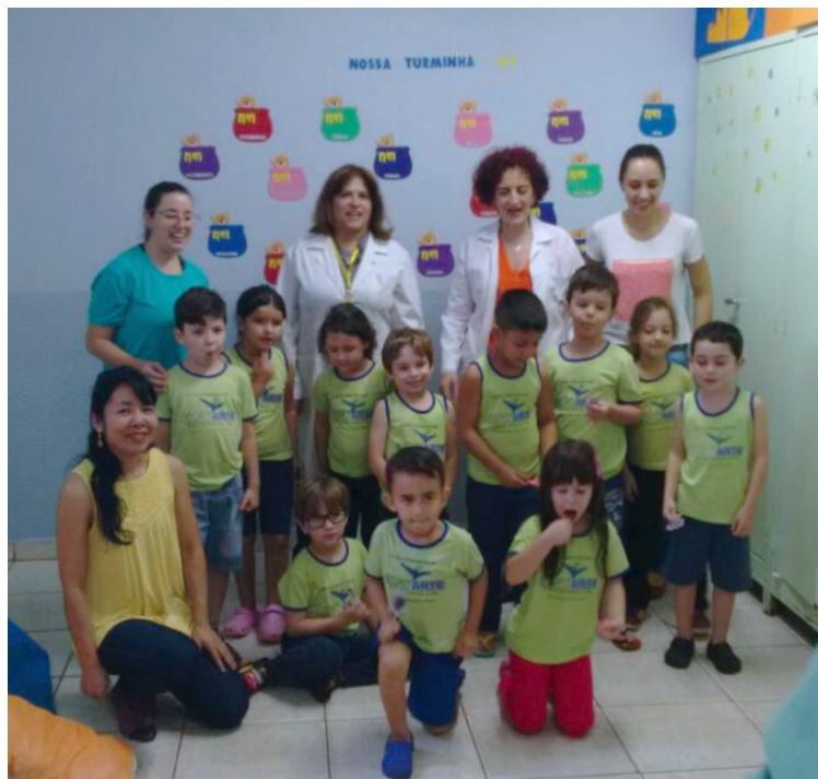
APLICACIÓN DEL PROGRAMA FARMACIA Y COSMÉTICA SOCIAL A NIÑOS DEL CENTRO EDUCACIONAL ENSINARTE, BRASIL.

El procedimiento para desmoldar la bala consiste en calentar a altas temperaturas el acero hasta desmoldar por completo; en este proceso se registran pérdidas y afectaciones en los puntos de fusión, sin mencionar el riesgo al que están expuestos los operadores. El prototipo ofrece eliminar en su totalidad el desperdicio de material y reducir el tiempo-costo de produc-