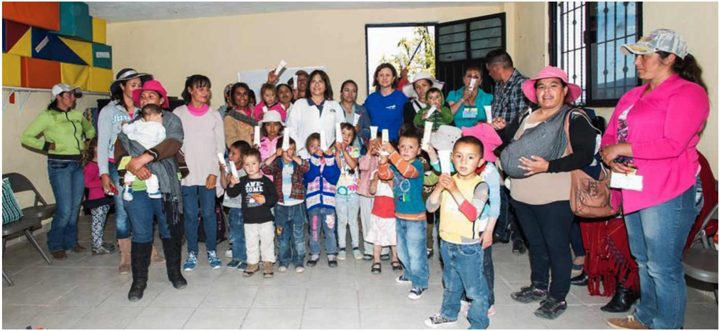
APLICACIÓN DEL PROGRAMA EN LA ORGANIZACIÓN NUTRE A UN NIÑO A.C., EN EL ESTADO DE MÉXICO.

Cosmética Social es mostrar que el uso de cosméticos influye positivamente en las personas para su inclusión social; también la educación en higiene personal y prevención de enfermedades proporciona a la sociedad un balance entre higiene personal y la confianza para integrarse a grupos sociales sin riesgo latente de transmisión de enfermedades infecciosas , provocadas principalmente por la falta de higiene al preparar los alimentos y en el saludo de mano. Es presentado a niños en edad escolar para que, a su vez, sea transmitido a sus padres, formando un núcleo familiar consciente de la importancia del uso de cosméticos en la higiene personal y bienestar familiar.