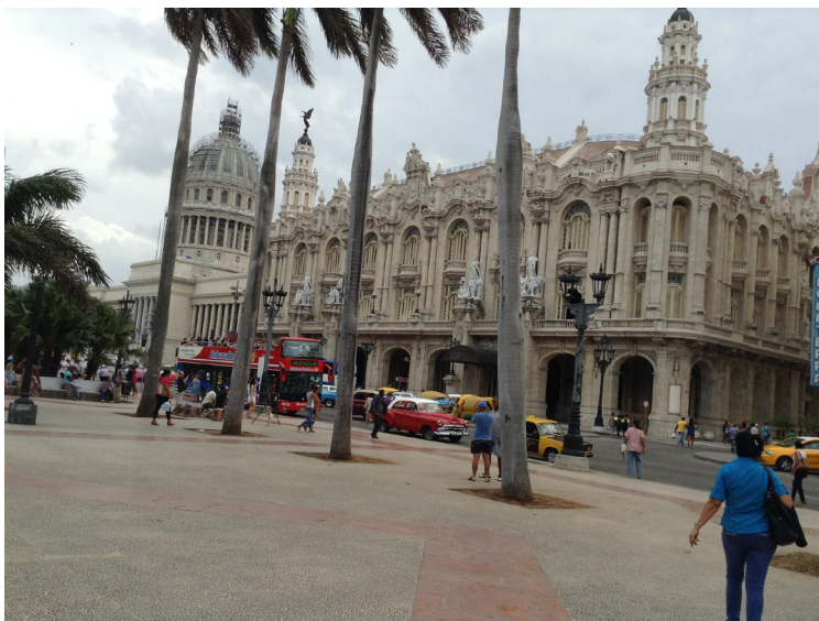
TEATRO NACIONAL "ALICIA ALONSO" EN LA HABANA, CUBA, SEDE DE LA SEXTA CONFERENCIA PANAMERICANA, DONDE SE FUNDÓ LA COMISIÓN INTERAMERICANA DE MUJERES EN 1928.

En 1928 se funda la CIM en La Habana, durante la Sexta Conferencia Panamericana . Es el primer organismo intergubernamental en el mundo fundado expresamente para luchar por los derechos de la mujer. En esta Conferencia participaron 21 Estados latinoamericanos y Estados Unidos y fue gracias al esfuerzo de las feministas cubanas y norteamericanas que exigieron incluir el tema de mujeres dentro de la Conferencia e hicieron un gran cabildeo. Logran encontrar la