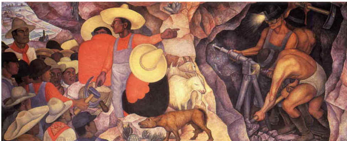
EL AGITADOR. DIEGO RIVERA