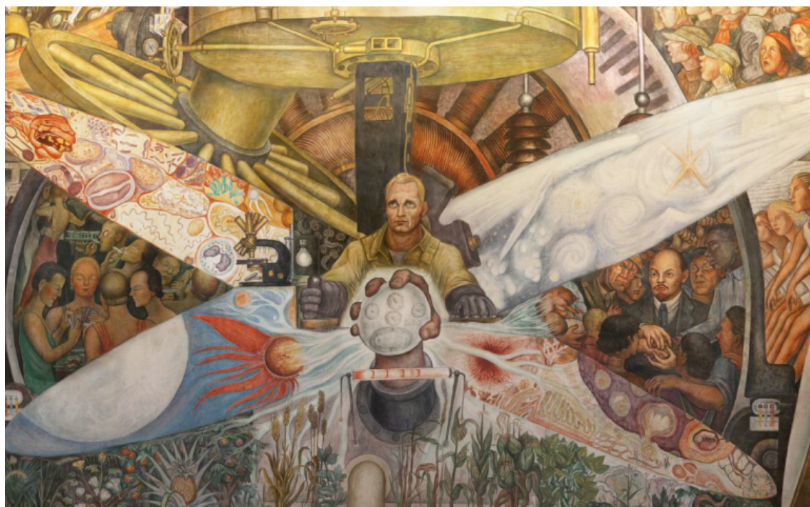
EL HOMBRE CONTROLADOR DEL UNIVERSO. DIEGO RIVERA

concentración económica que se da en el sector de telecomunicaciones -uno de los más dinámicos en crecimiento en nuestro país y en el mundo- faltan aún por diseñar y evaluar los mecanismos regulatorios y de control efectivo para propiciar una competencia efectiva entre las empresas que participan en este sector.