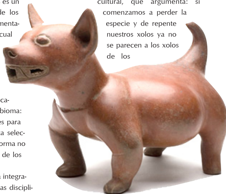
FOTOGRAFÍA: PERROS CON HISTORIA

cultural, que argumenta: si comenzamos a perder la especie y de repente nuestros xolos ya no se parecen a los xolos de los