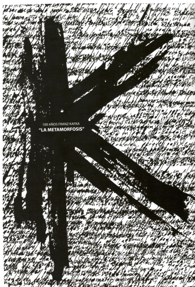
CARTEL: ÁNGEL DE JESÚS SAUCEDO ENRÍQUEZ, MÉXICO

La serie “Interferencias e irrupciones al sentido común” está compuesta